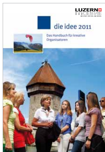
Die Idee Das Handbuch für kreative Organisatoren