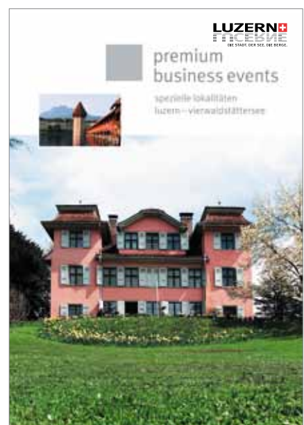
Premium Business Events Spezielle Lokalitäten Mit über 70 unkonventionellen Räumlichkeiten