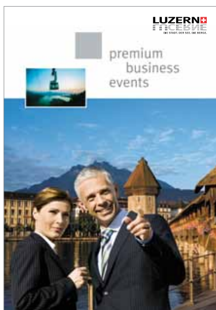
Premium Business Events Tagen mit Mehrwert